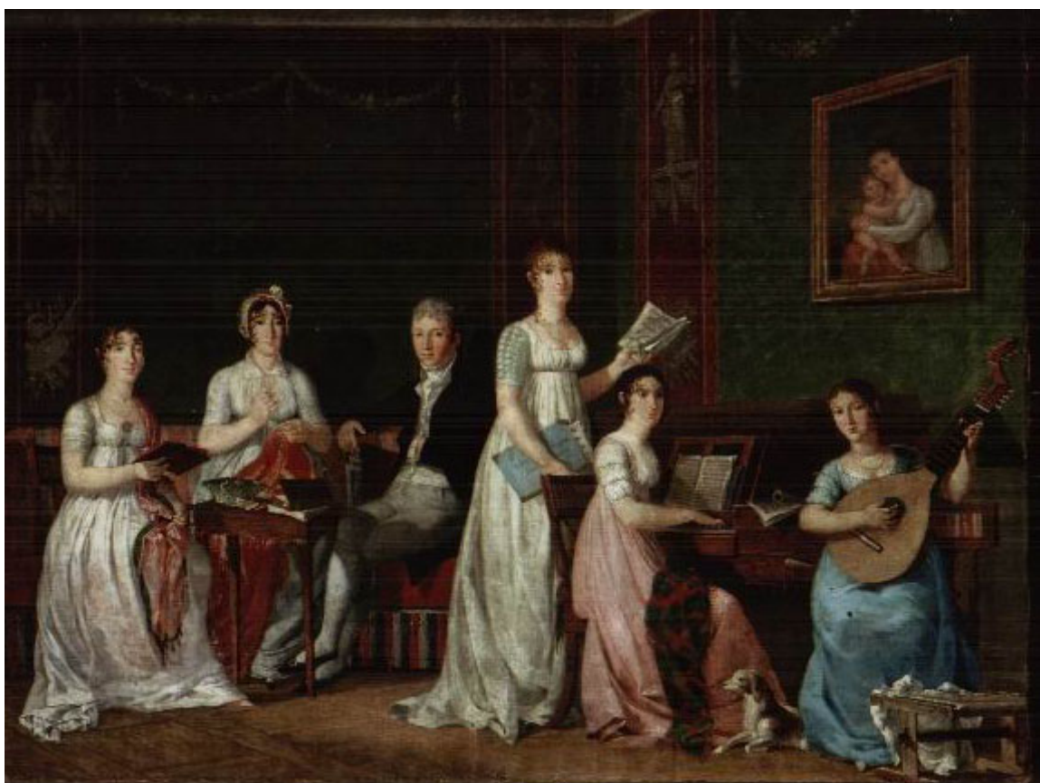
Anonym konstnär, Sverige(?) ca 1800-1810. Oljemålning i privat ägo.