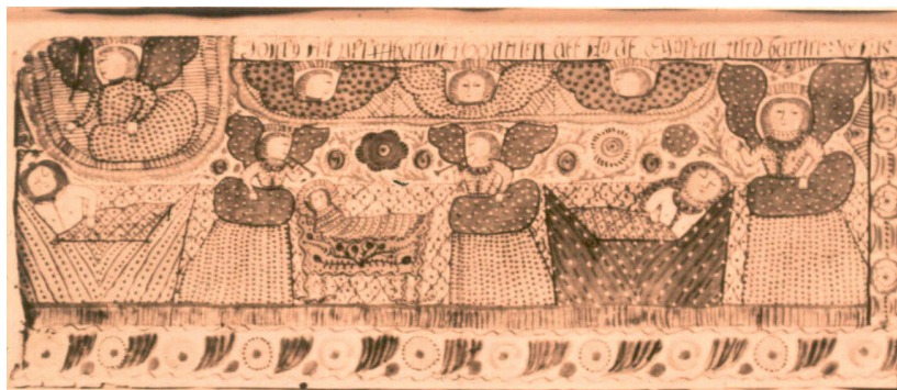
Fig. 7: Sunnerboskolan, Josefs dröm. Målning på papper. [Göteborgs museum. GM 11.006]

Förlagorna kopieras inte i detalj på bonaderna. Tvärtom – ”onödiga” saker utelämnas, motivet förenklas och dekorationer läggs till.