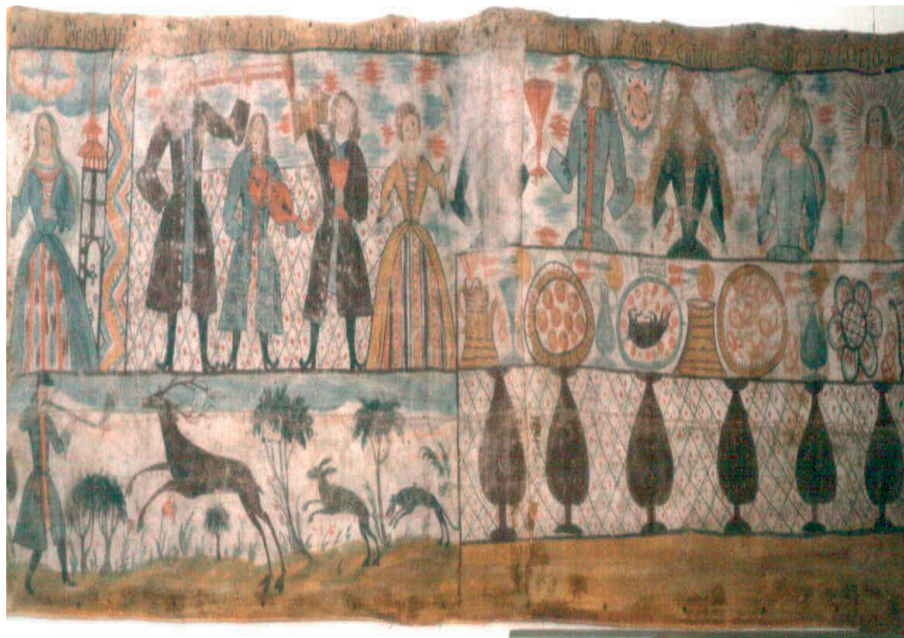
Fig. 9: Anon. 1700-tal, Bröllopet i Kana.

Bröllopet i Kana är ett populärt motiv. Många bröllop ägde rum i juletid och det är också den tid på året då bonaderna hängdes upp. Kanske förklarar det motivets popularitet.