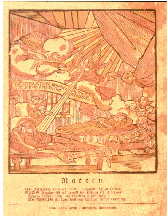
Fig. 6: Kistebrev 1811, Natten. [Nils-Arvid Bringéus, Skånska kistebrev , Lund 1995, s. 138.]