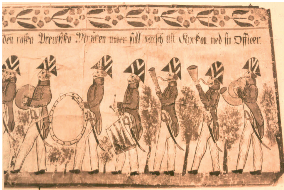
Fig. 10: Kyrkhult-Linneryd-gruppen, 1800-tal, Militär procession, detalj. Målad ca 1830/1840. [Kulturen i Lund.]

Bröllopståg som visar musiker som en del i processionen är ett ganska vanligt motiv. Militära processioner däremot är ovanliga.