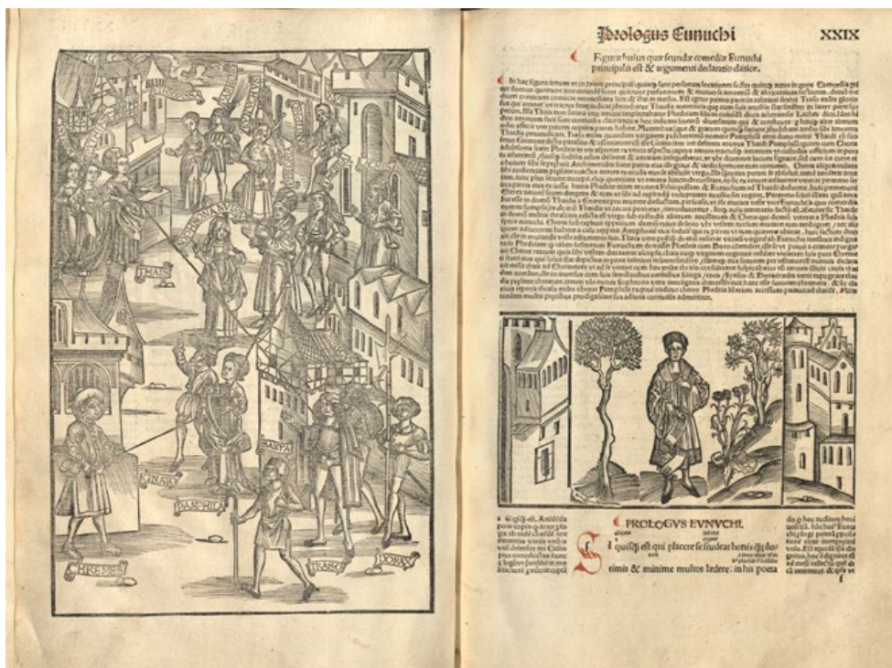
Figurae declaratio på vänster sida och ett träsnitt tillhörande prologen till Eunucken på höger. (MTB)

Mest iögonfallande med denna edition är nog ändå de många träsnitten som ackompanjerar texten. Varje pjäs inleds med en så kallad figurae declaratio – ett helsidesstort träsnitt som visualiserar pjäsens dramaturgi och med hjälp av pilar vägleder läsaren genom handlingen. Grüninger-utgåvan är den första kända edition som använder sig av denna teknik. 5