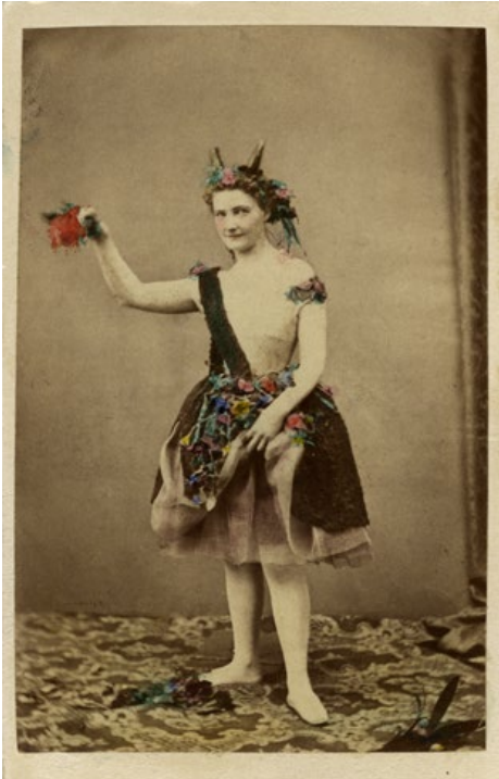
Elise Hwasser, rollporträtt 1861.

Att för hand färglägga de sepia-tonade, monokroma fotografierna blev vanligt under senare hälften av 1800-talet. I våra samlingar finns gott om kolorerade rollporträtt från framför allt 1860-talet.