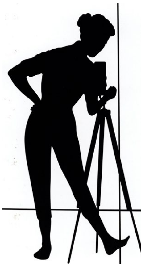
Fram- och baksida till Beata Bergströms bok Foto . (MTB)