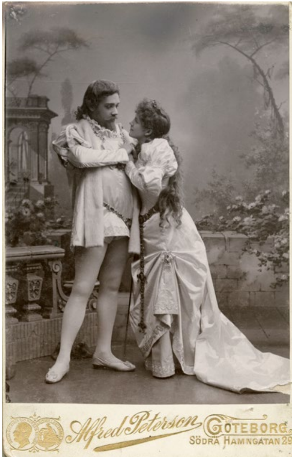
Scen ur Ljungby Horn, 1893.