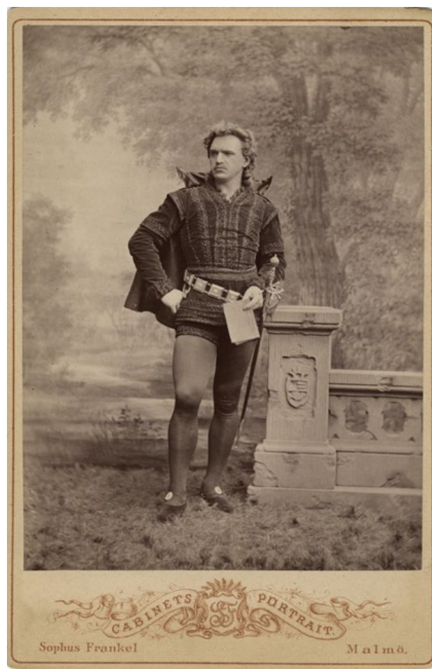
August Lindberg som Hamlet, 1884.