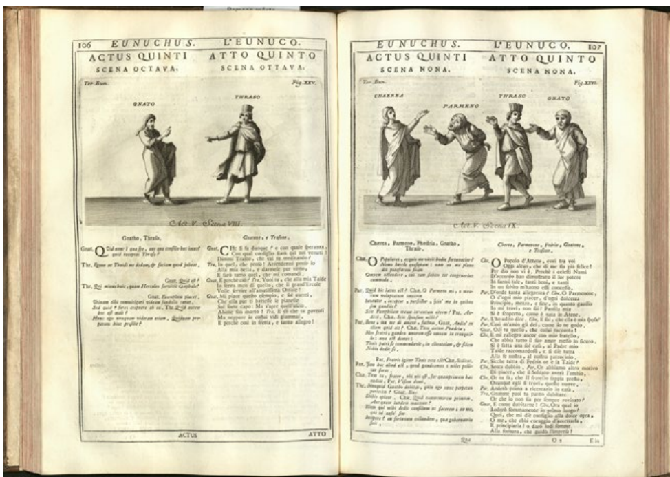
Text och litografier ur Terentius Eunucken . (MTB)

Om vi hoppar fram några hundra år i teaterhistorien så finns ytterligare en spännande utgåva av Terentius pjäser publicerad 1736. 7 Här ger accessionsnumret vid handen att den fördes in i bibliotekets katalog 18 oktober 1959. 8