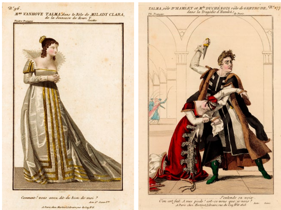
Gravyrer föreställande Charlotte Vanhove och François-Joseph Talma i Petite galerie dramatique, 1796–1843.