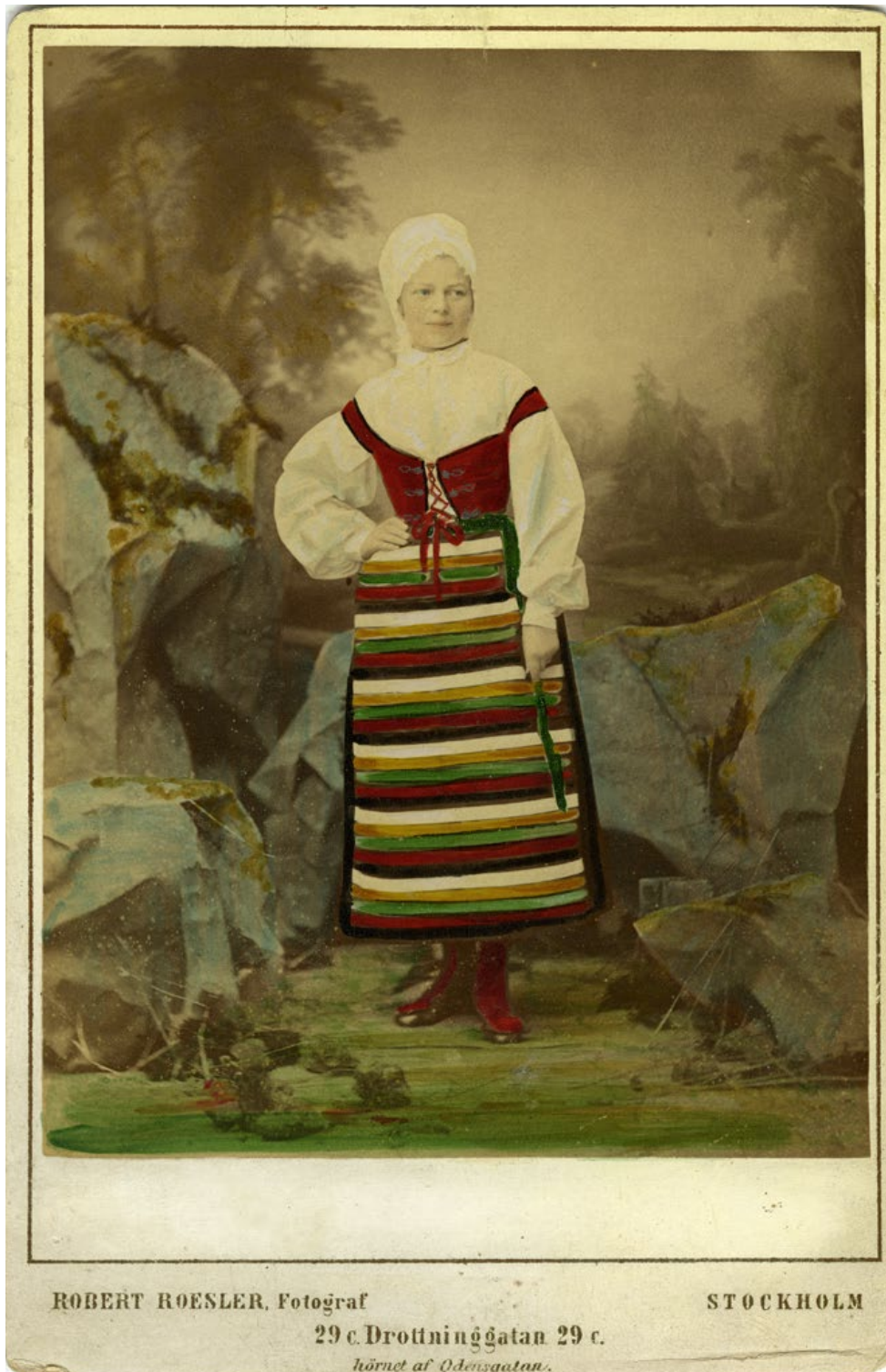
Anna de Wahl, rollporträtt 1870-tal.

När de så kallade kabinettsporträtten (fotografier i större format) började framställas under 1870-talet utvecklades koloreringen; nu kunde även bakgrunden färgläggas. Rollporträttet av operettsångaren Anna de Wahl är ett bra exempel på detta.