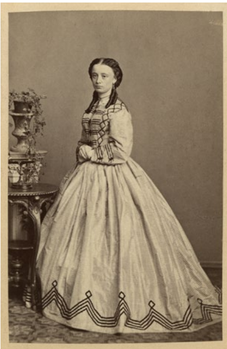
Griselda Deland, porträtt 1860-tal.