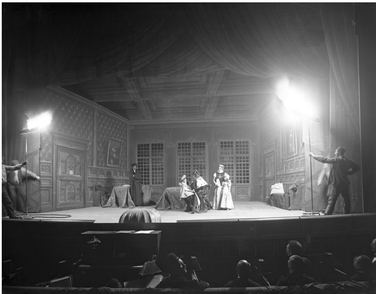
Scen ur skådespelet Erik XIV på Svenska teatern, 1899.

Glasnegativet nedan visar hur fotograferingen gick till; skådespelarna är frusna i sina poser medan de stora blyxtaggaten fyras av. Allt inför en intresserad publik i orkesterdicket. Under det tidiga 1900-talet var det här det enda sättet att fotografera föreställningar, för dokumentation men framför allt för publicering i tidskrifter som Scenisk konst . Den utgavs under åren 1902-1915. I våra samlingar finns ett stort antal av de fotografier som publicerades i tidskriften, framför allt glasnegativ från Atelier Jaeger och Anton Blomberg.