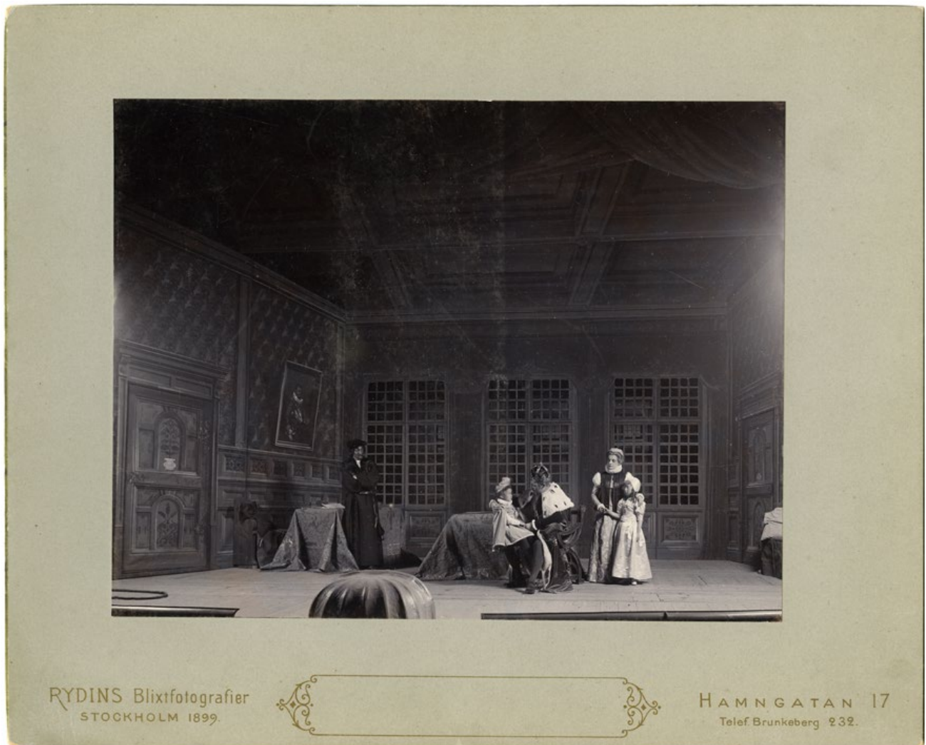
Scen ur skådespelet Erik XIV på Svenska teatern, 1899.

När själva fotografiet framställdes beskars det och monterades på kartong. Detta är det färdiga resultatet.