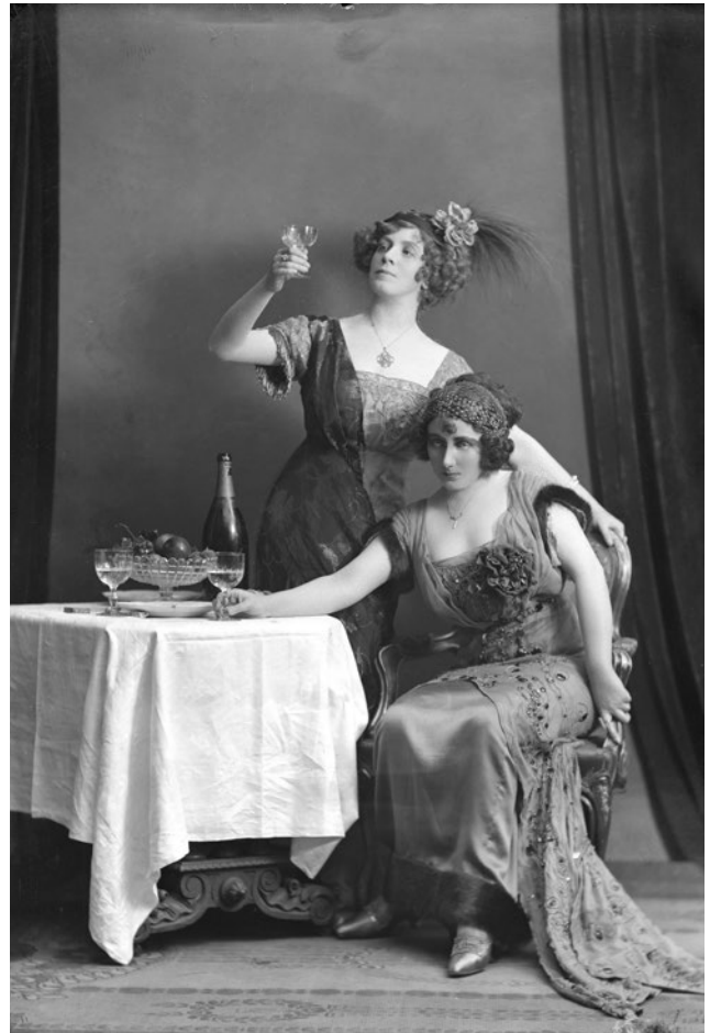
Scen ur Den starkaste , 1911. Glasnegativ.