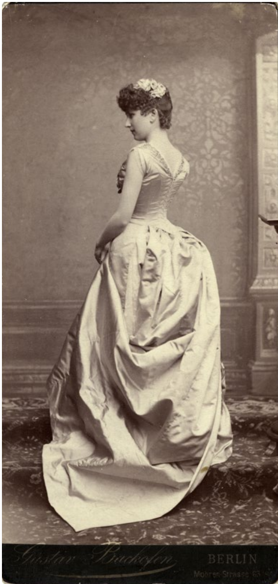
Sigrid Arnoldson, porträtt 1885.