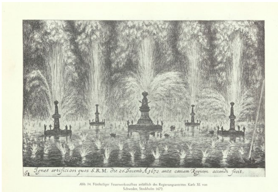
Abb. 34. Fünfteiliger Feuerwerksaufbau anlässlich des Regierungsantrittes Karls XI von Schweden, Stockholm 1672.