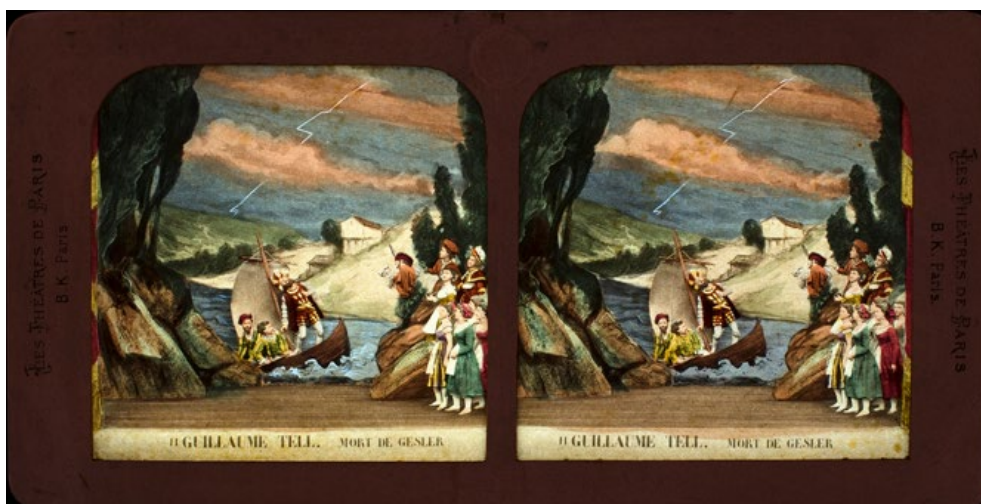
Scen ur operan Wilhelm Tell . Stereokort (belyst bakifrån).

Scenerna är uppbyggda av kulisser av kartong och figurer i papp, gips eller lera och sedan avfotograferade. Fotografierna är monterade i kartongramar och handkolorerade på baksidan. När man tittar på dem i stereoskop belysta framifrån är de monokroma, belysta bakifrån ser man de gömda färgerna.