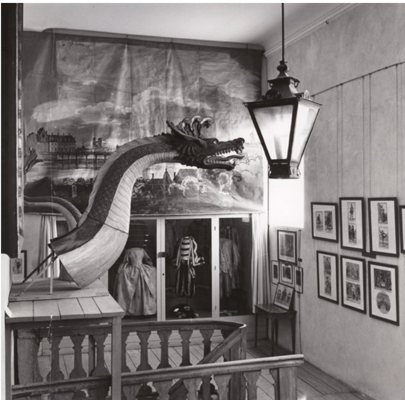
Drottningholms teatermuseums utställning vid trappan upp till salongen (foto: Per Bergström). (MTB)