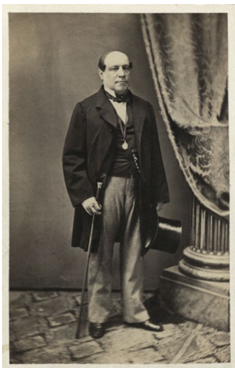
Pierre Joseph Deland, porträtt 1860.

Många av artistfotografierna från 1860-talet är tagna av fotografen Jacob Lundbergh vars ateljé låg ett stenkast från Södra teatern i Stockholm.