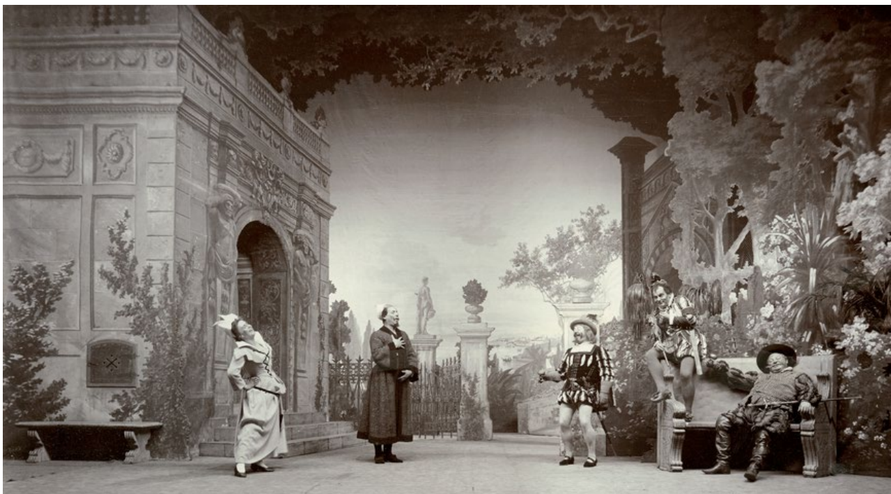
Scen ur Shakespeares komedi Trettondagsafton på Dramatiska teatern, 1900.