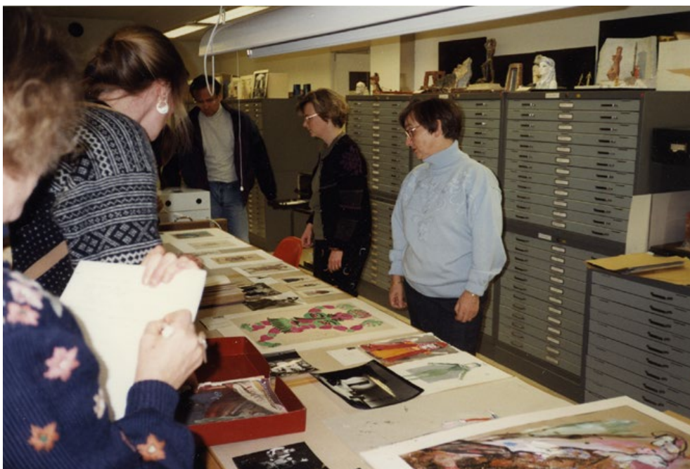
Framplockade kostymskisser i gravrysalen, Drottningholms teatermuseum, Filmhuset.