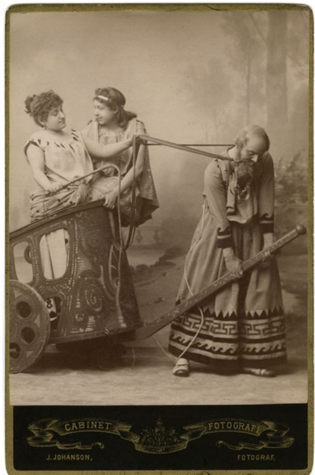
Scen ur Aristoteles , 1886.