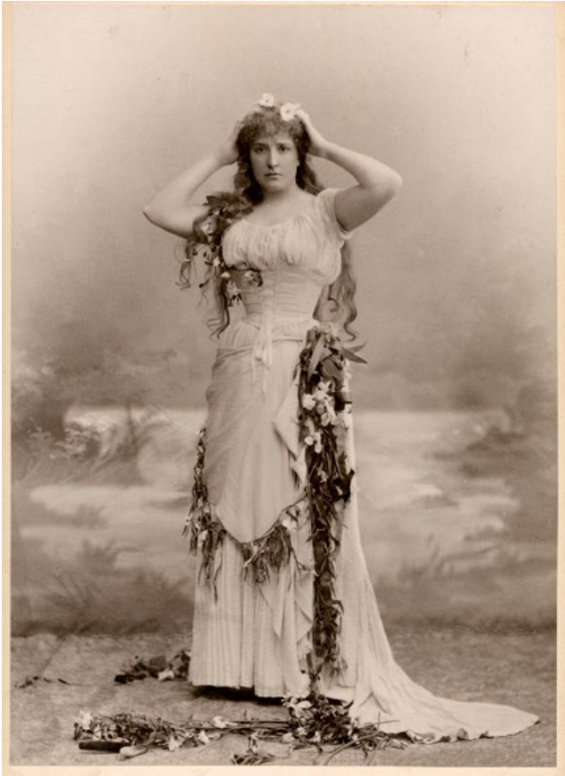
Nellie Melba som Ofelia, 1893.