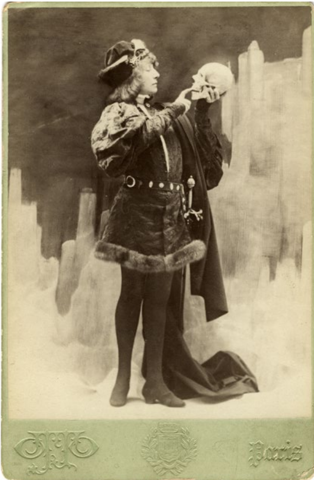
Sarah Bernhardt som Hamlet, 1899.