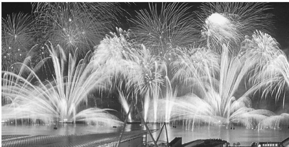
Fotografi av fyrverkeri hållet under L'Éxpositions des Océans i Lissabon 1998 (originalbilden i färg). (MTB)

Lustigt nog påminner denna fyrverkerikomposition en smula om en av bilderna i en betydligt yngre bok. I Le théâtre du feu finns fotografier från bland annat L'Éxpositions des Océans som gick av stapeln i Lissabon 1998. 21