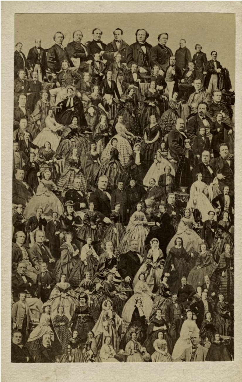
Svenska artister, mosaikbild 1860-tal.

De allra flesta av artistporträtten som använts till mosaikbilden finns i sitt ursprungliga visitkortsformat i våra samlingar.