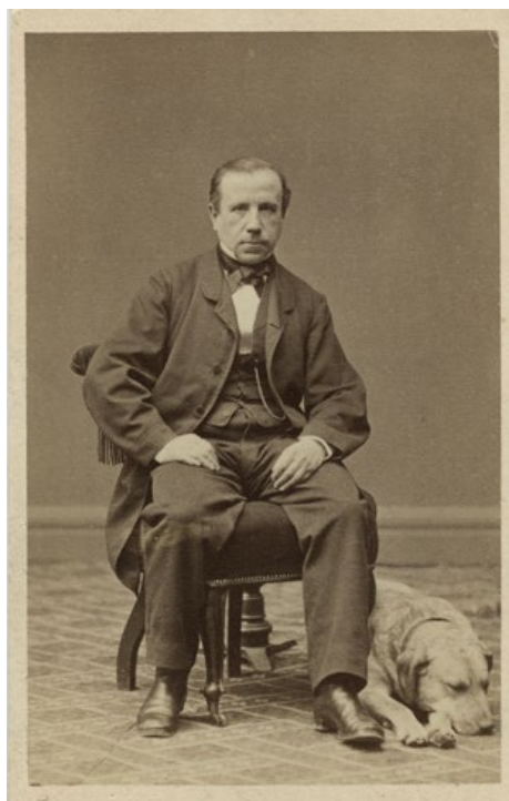
Fredrik Deland, porträtt 1860-tal.