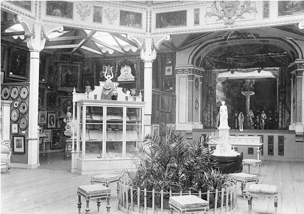
Stockholmsutställningen 1897, Allmänna konst- och industriutställningen – Musik- och teaterpaviljongen, insida. (MTB)

När man kom in i den runda paviljongen så möttes man rakt fram av en rekonstruktion av scenen till det nyligen rivna operahuset i skala 1:10, med slutscenen ur Naumanns opera Gustaf Wasa i Desprez scenografi och fyllda av rollfigurerna i kostymer. Allt noggrant kopierat efter originalen. Scenen kunde vridas så att man fick se hela teatermaskineriet. Till vänster fanns sen kabinett med dokument och föremål från den svenska teaterns – framför allt Kungliga teatrarnas – värld. På höger sida ett liknande kabinett från musikens område med Claudius stora instrumentsamling.