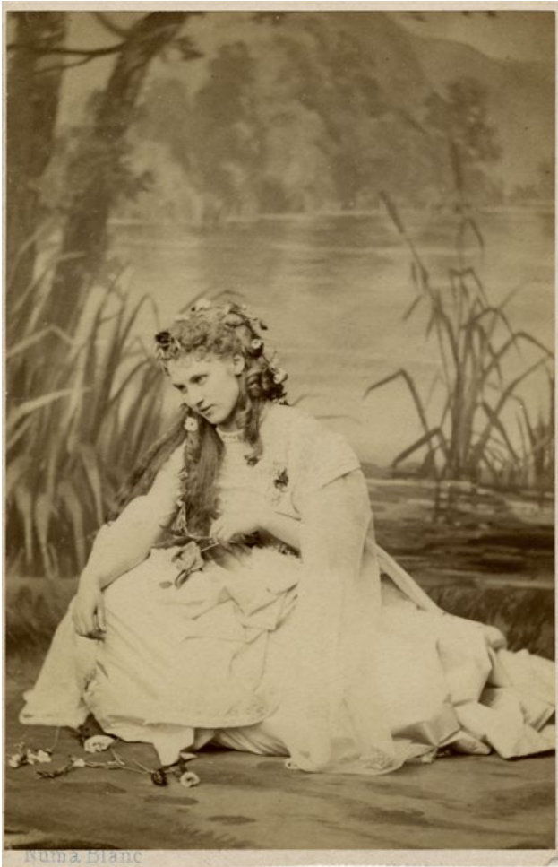
Christina Nilsson som Ofelia, 1868.