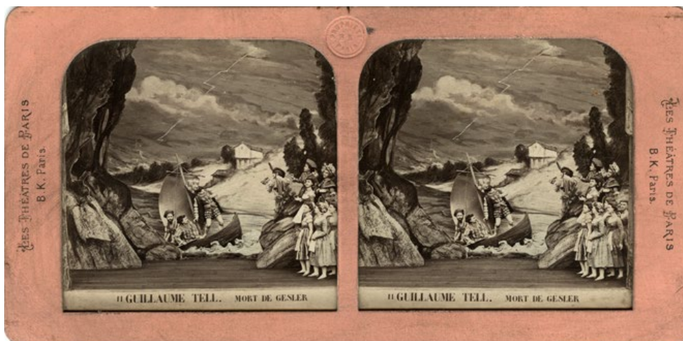
Scen ur operan Wilhelm Tell . Stereokort.

Särskilt intressant är samlingen av stereokort tillverkade i Frankrike under andra hälften av 1800-talet. Dessa köptes troligen in på grund av motiven: gestaltade scener ur operor och skådespel. Med hjälp av ett stereoskop kan man uppfatta stereofotografins 3D-effekt. Den som någon gång använt en View-Master kan känna igen tekniken. 4