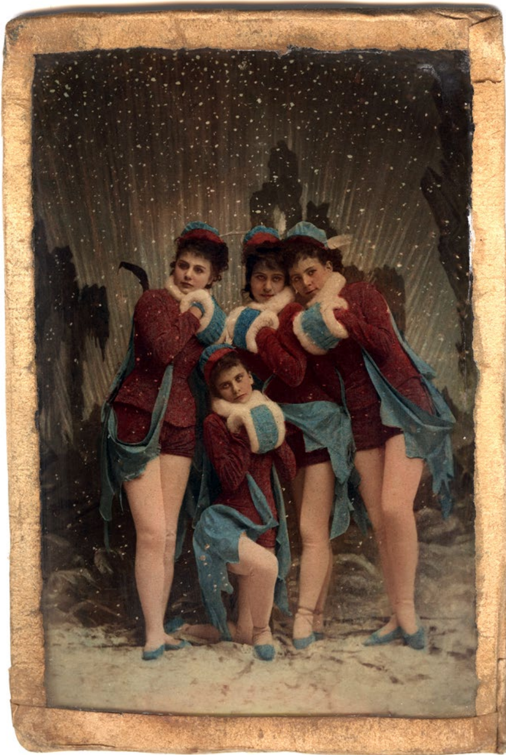
Från Jorden till månen , 1877.

Ett lite ovanligt kolorerat fotografi är denna handmålade glasplåt där dansarna i feerioperetten Från jorden till månen på Djurgårdsteatern 1877 försetts med väldigt färgglada kostymer.